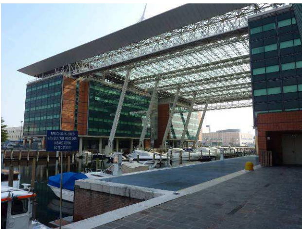
Slika 1: Lokacija IECS 2013

Simpozij s približno 370 udeleženci se je odvijal od 10. do 12.4.2013 v Mestrah pri Benetkah. Uvod vanj je bila 9.4. delavnica »Workshop on Fundamentals, Practical tools and Applications of Risk Informed Dam Safety Management« (ni bila v sklopu simpozija), zaključil pa se je z ekskurzijama na pregrado Vajont in na obrambni sistem Benetk pred morjem, imenovan Sistem MOSE, ki sta bili organizirani 13.4.2013. Razpisane teme so bile naslednje: